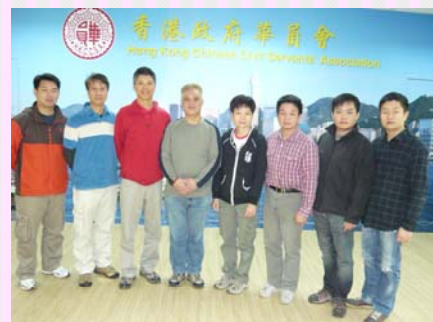
執委會委員合照 (副主席缺席)

回顧過去一年，第10屆海關關員級分會執行委員會謹守會章以身作則，履行華員會會章，遵循華員會的使命、宗旨及目標，執行華員會會員代表大會、理事會及獲其授權的專責委員會，以及分會會員大會、分會執行委員會的議決；參加分會執行委員會會議並接受其指示；克己奉公、廉潔守正、盡忠職守。