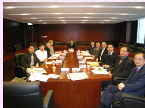
分會參與部門諮詢會議

2010年度分會共參與了4次與部門諮詢會議，會議由海關副關長主持，分會亦藉此將會員同事的意見直接向部門管理高層反映，尋求解決方案。並爭取和跟進下列事項：