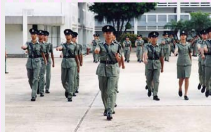
現時的制服經多次改良

分會於2010年度共參與了2次部門制服檢討工作小組會議，致力反映會員就制服及裝備的意見，爭取部門為同事提供舒適的制服及改善裝備。