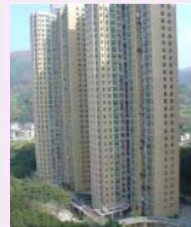
沙田海泓閣海關宿舍

近年海關不斷增聘人手，合資格已婚人員數目持續增長，對部門宿舍的需求亦有增無減。但過去十多年，關員級職系的宿舍欠缺率由最低的16.50%升至現時31.43%，欠缺623個宿舍單位。雖然一直以來海關部隊行政科均定期將宿舍欠缺情況上報保安局，但得不到局方的重視，令海關宿舍出現嚴重短缺的情況一直無法改善，欠缺率續年惡化，顯示現有機制名存實亡，令海關同事們無法接受。