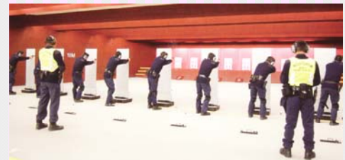
海關總部大樓室內靶場

關注海關總部大樓的室內靶場通風設備是否達安全標準，確保當同事在射擊練習時室內空氣中的鉛或其他重金屬含量不會超標，保障同事的健康。